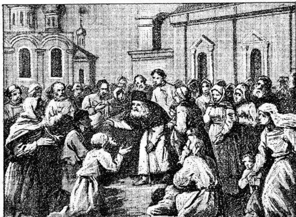
Преп. Серафимъ благословляетъ народъ по выходѣ изъ храма.