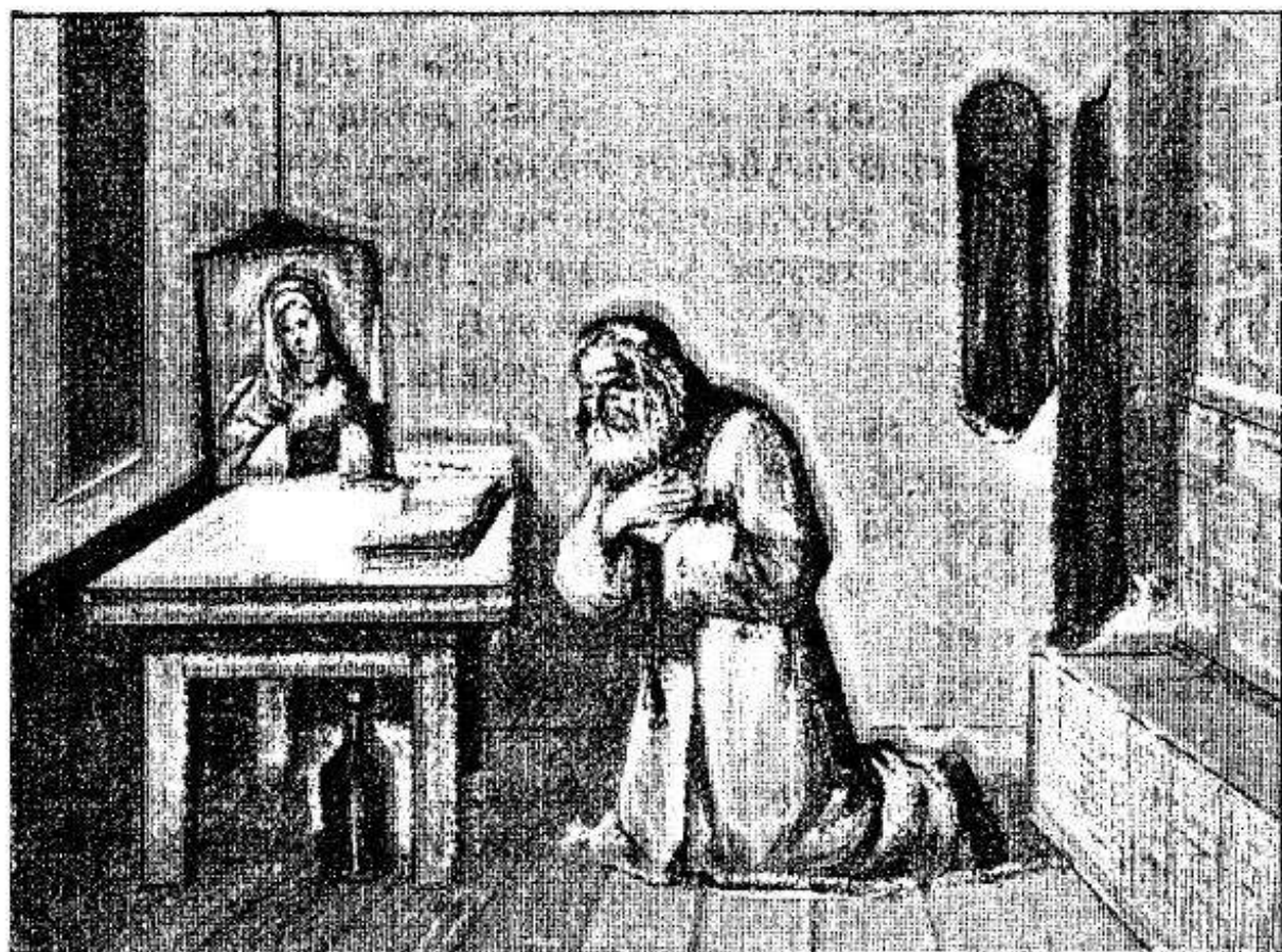
Кончина преп. Серафима на молитвѣ передъ иконою Богоматери.